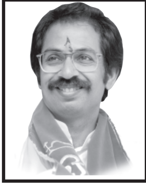
मा. श्री. उद्धवजी ठाकरे मुख्यमंत्री (महाराष्ट्र राज्य)